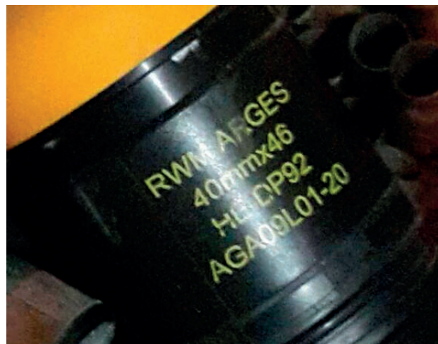
: ARGES-Granate nach dem Einsatz in al-Awamiya